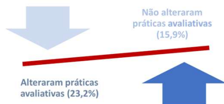
Figura 2. Posição dos professores com experiência de IA sobre a alteração das práticas avaliativas (% do total)

No que concerne ao combate à fraude, os professores referiram que i) evitam trabalhos que potenciem o recurso à IA, ii) fazem a verificação da originalidade de trabalhos objetivando detetar o plágio e iii) responsabilizam os alunos quanto à má utilização da IA. Uma proporção menor (23%) assume a realização de práticas avaliativas com IA, sintetizadas na Figura 4